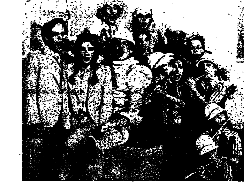
لقطة من الفيلم الموسيقي «فانتاستيكا» بطولة لور كارول (كندا)

جان لوي تريتينيان ، نيتوروي غاسبان ومارشيلو ماستريوني الذي تلا ذلك في فيلم نديكو